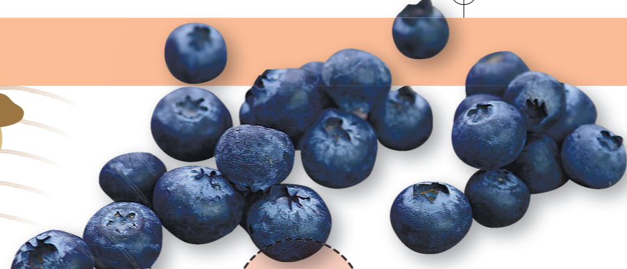
6月～8月下旬 ブルーベリー

信州には魅力溢れる58の町と村があります。各地の収穫祭を巡って、おいしい特産物・豊かな自然や温かな地元の人々に触れてみませんか!